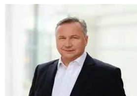
Roland Kaiser - Double Steffen Heidrich