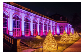
Christmas Garden Pillnitz