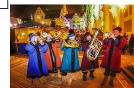
Rauhnächte in Dresden

Mi. 07.01. Fr. 09.01. Mi. 14.01. Do. 15.01. Fr. 16.-So. 25.01. TIPP!!