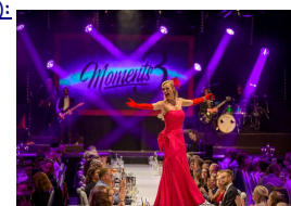
LunchShow Moments 3 - Dresden

16.00Uhr 98,- € 13.00Uhr 92,- € 10.00Uhr 88,- € 13.00Uhr 59,- € 13.00Uhr 67,- € 11.00Uhr 35,- € 10.00Uhr 87,- € 14.00Uhr 50,- € 10.00Uhr 52,- € 09.30Uhr 163,- € 13.00Uhr 97,- € 10.00Uhr 54,- € 11.00Uhr 93,- € 14.00Uhr 55,- € 08.00Uhr 30,- €